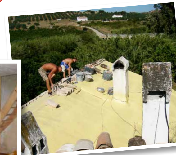
Nieuw dak voor de watermolen