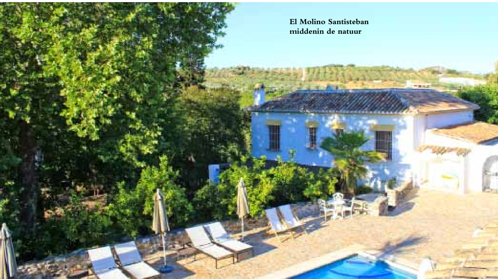
El Molino Santisteban middenin de natuur

Veel mensen dromen ervan: hun spullen pakken en ergens in het buitenland opnieuw beginnen. Sommigen durven de stap écht te zetten. Zoals Madeline en Gerard die een oude Spaanse molen nabij Marbella kochten en ombouwden tot een bloeiende B&B El Molino Santisteban.