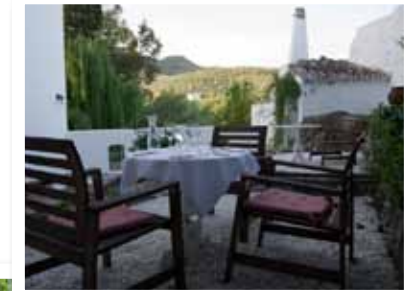
Terras van El Molino met uitzicht op de heuvels