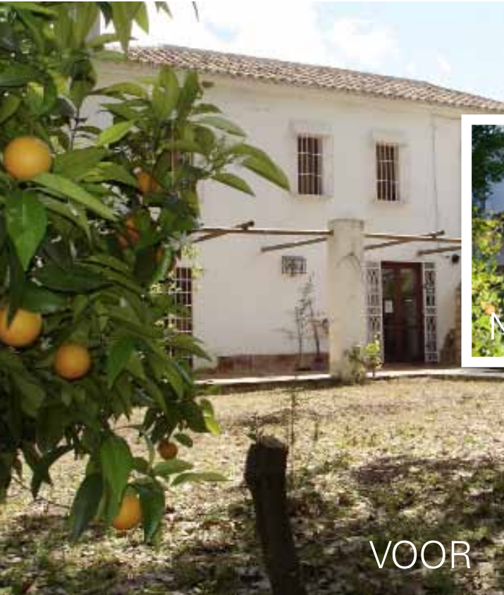
De tuin bij het hotel oogde aanvankelijk als een stukje wildernis